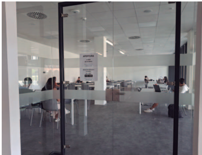
Nueva sala de estudio en el Centro Cultural y Biblioteca Benjamín Palencia

ubica en la segunda planta del nuevo Centro Cultural y Biblioteca Benjamín Palencia, cuyas obras finalizaron recientemente. Este equipamiento, construido por el Área de Obras y Equipamientos con una inversión de 7,8 millones de euros, cuenta con una