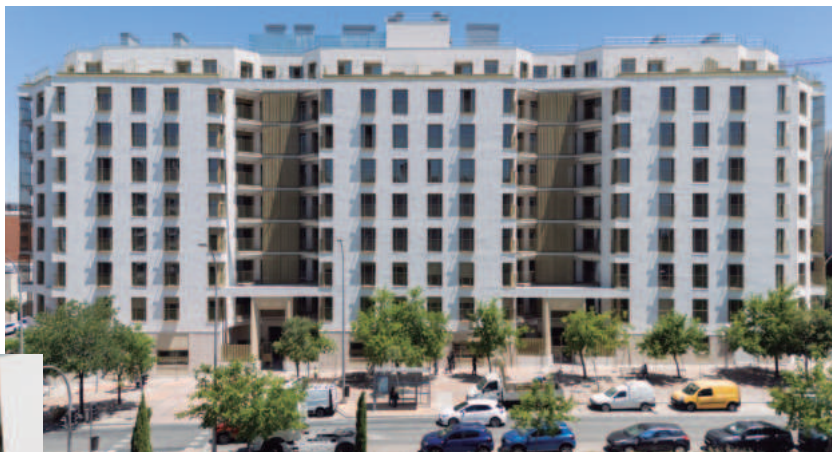
Momento de la visita en una de las viviendas de la promoción Vallecas 62

el Indicador Público de Renta de Efectos Múltiples (IPREM), una medida orientada a facilitar el acceso a la vivienda a familias y jóvenes con rentas