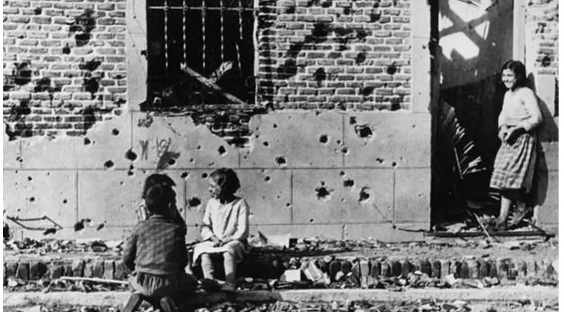
La casa fotografiada por Robert Capa

Durante una atención a los medios, Almeida subrayó que el Consistorio tiene “un proyecto muy claro” para el edificio y aseguró que la iniciativa respeta plenamente su valor patrimonial. “Entendemos que debe honrarse la memoria de Robert Capa y, al mismo tiempo, desarrollar un proyecto dirigido especialmente a los jóvenes de un barrio con importantes condiciones de vulnerabilidad”, señaló.